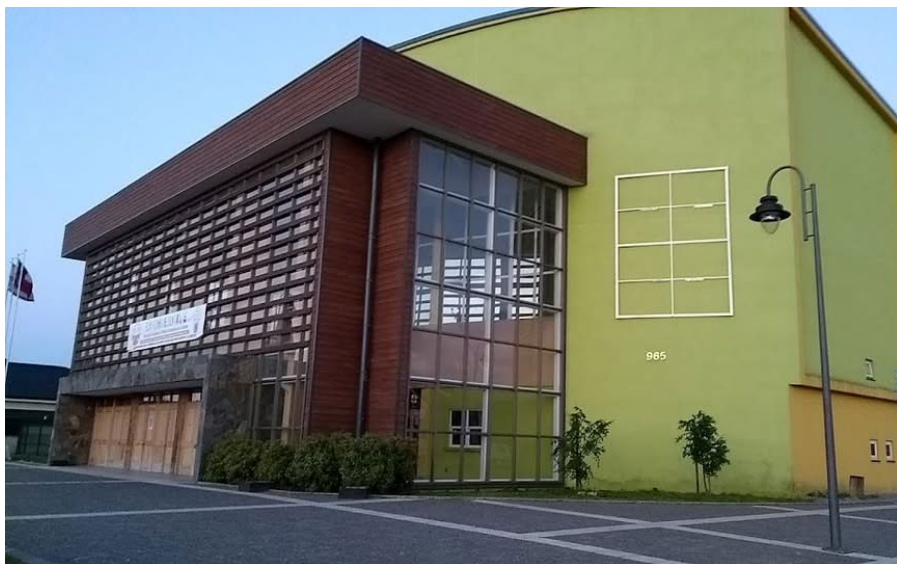
GIMNASIO FISCAL Ramon Ricardo Rozas N.° 965 Puerto Varas